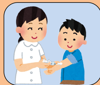
インフルエンザ予防接種補助